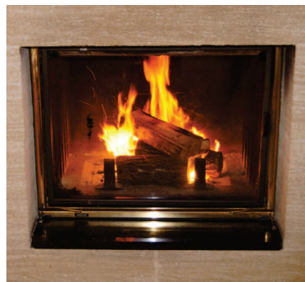
Foyer fermé à l'aide d'un insert (on distingue la vitre de protection et son encadrement)

La combustion se fait dans des conditions physiques inadaptées : elle a un rendement médiocre et émet beaucoup de particules.