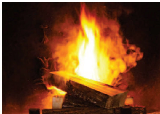
Foyer ouvert DRIEE-IF 2013

Dans une cheminée à foyer ouvert, il n'y a pas de vitre de protection ni d'enceinte de combustion : le bois brûle à l'air libre.